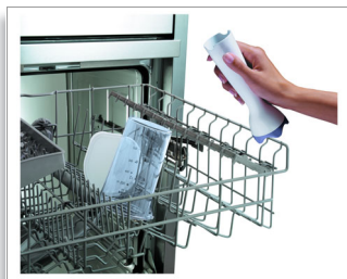
Accessori lavabili in lavastoviglie