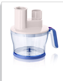
Accessorio per robot da cucina da 1,5 l