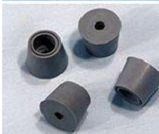
015 KW7053 PIEDINI (4 PEZZI) 75