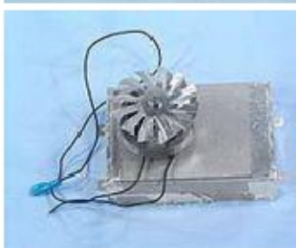
008 KW7031 ASSIEME VENTOLA 57