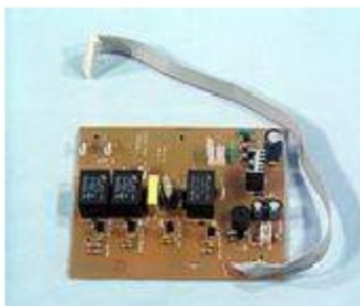
010 KW7031 SCHEDA CONTROLLO: FINO A 71 APRILE 2006