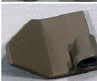
006 KW7031 PALA 8mm - (BM350 CESTELLO 33 RETTANGOLARE/ROTONDO)(BM250/256 CESTELLO ROTONDO) PRE- TWIST&LOCK *utilizzabile per cesto rettangolare modello BM350 *utilizzabile per cesto rotondo modelli BM250-BM256- BM350