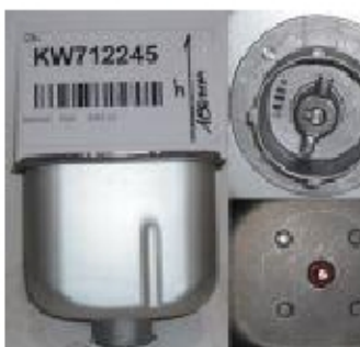
KW7122 45 CESTELLO PANE - (BM450)(BM350 TWIST&LOCK) (altezza 180mm)