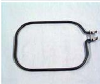
013 KW7032 RESISTENZA 00