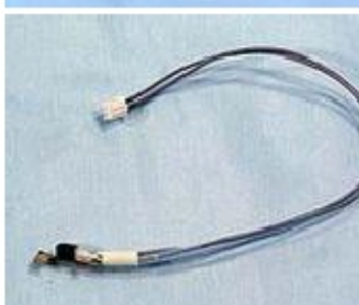
009 KW7031 ASSIEME TERMISTORE 69