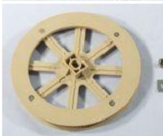
KW7128 64 ASSIEME PULEGGIA GRANDE inclusi Guida e Dado (per modelli con sistema 'Twist & Lock')