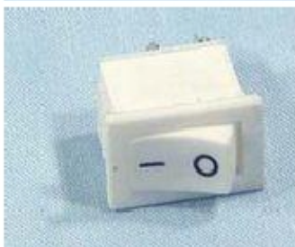
003 KW7030 28 INTERRUTTORE ON/OFF