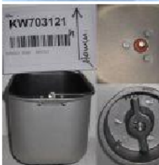
005 KW7031 CESTELLO PANE - BM350 PRE- 21 TWIST&LOCK (altezza 170mm)