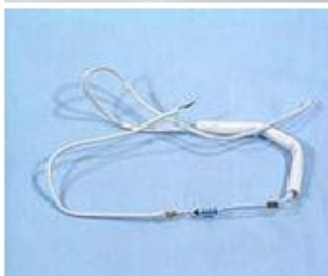
002 KW7029 95 FUSIBILE TERMICO 172°C