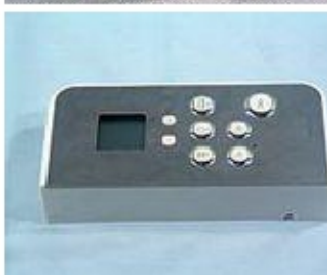
007 KW7031 CRUSCOTTO COMPLETO CON 45 SCHEDA: FINO A APRILE 2006 - NON DISPONIBILE ORDINARE I CODICI KW712990 KW712989