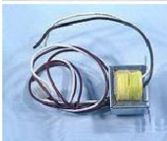
014 KW7032 TRASFORMATORE 12