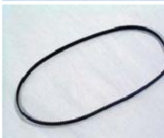
012 KW7031 CINGHIA 95