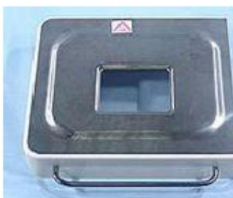
004 KW7031 ASSIEME COPERCHIO COMPLETO - 19 ACCIAIO