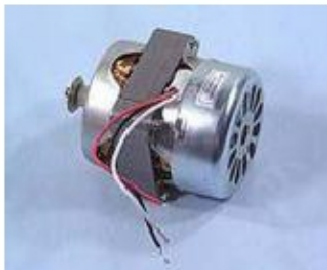
011 KW7031 ASSIEME MOTORE 83