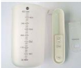
001 KW7029 33 MISURINO CON DOSATORE